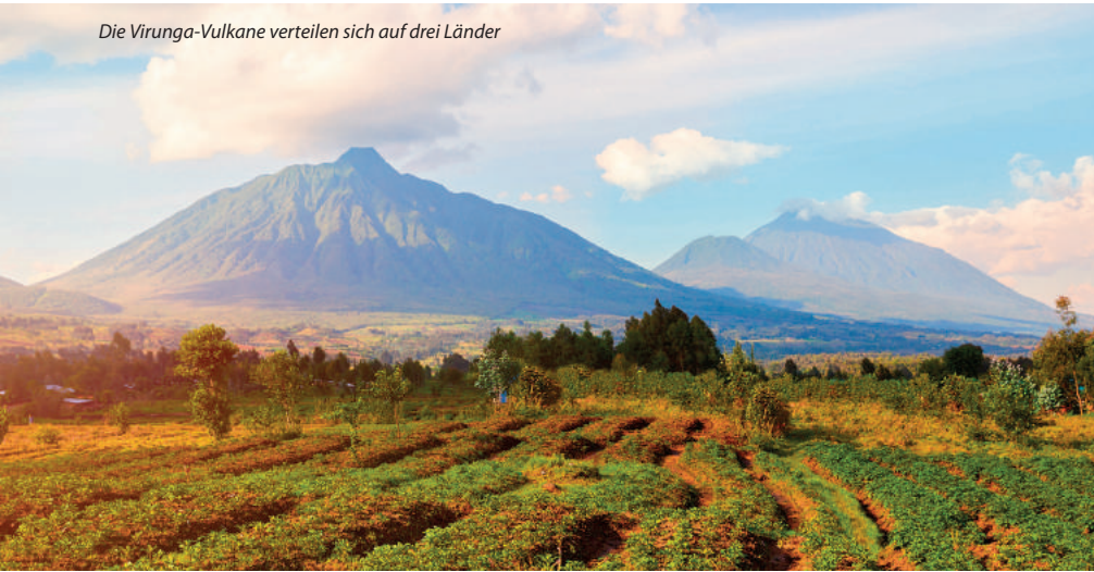
Die Virunga-Vulkane verteilen sich auf drei Länder

Schönheit und Ruhe, die warme Herzlichkeit der Menschen, die atemberaubende Vulkan-Landschaft mit dem riesigen Artenreichtum, aber auch eine tragische Vergangenheit – all das ist Ruanda. Hier eröffnet sich Ihnen ein ganz eigenes Paradies, das gefühlt weit entfernt liegt vom Rest der Welt. Entdecken Sie die faszinierende Natur im „Land der tausend Hügel“ und verbringen Sie Zeit mit einer Berggorilla-Familie, die in aller Ruhe ihrem Alltag nachgeht – sicher der Höhepunkt jeder Reise nach Ruanda. Exklusive Lodges setzen auf Nachhaltigkeit und den Einklang von Mensch und Natur – hier werden Traditionen bewahrt. Erleben Sie unvergessliche Momente auf Ihrer Tour durch das kleine, aber beeindruckende Land im Herzen Afrikas!