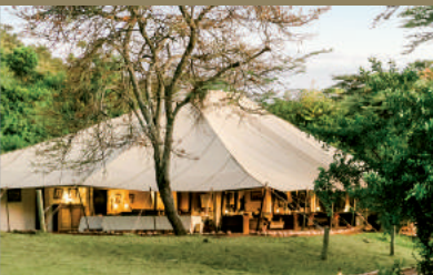
Masai Mara | Cottar's 1920s Safari Camp 5* Tent, Vintage-Luxus vom Feinsten