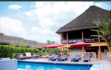
Volcanoes | Five Volcanoes Boutique Hotel 4* Deluxe Room, Perfekter Ausgangspunkt für Gorilla-Trekking